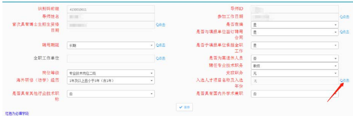
表1-1-1博士导师信息(续1) (时点)必填